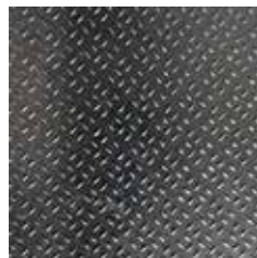
ลายเมล็ดข้าว