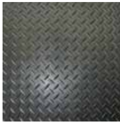
ลายโดมอนด์ (ตีนไก่)