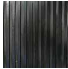
ลายร่องตรงใหญ่