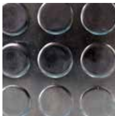
ลายเหรียญ